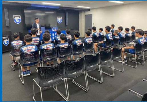
スタジアムツアー (吹田スタジアム)