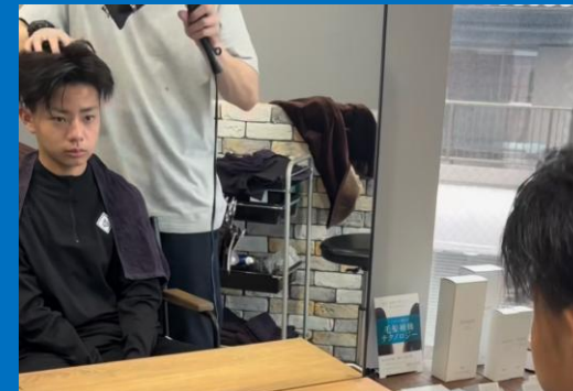
パートナー企業企画