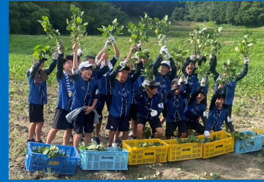
農業収穫・販売体験 (エブリイ共同企画)