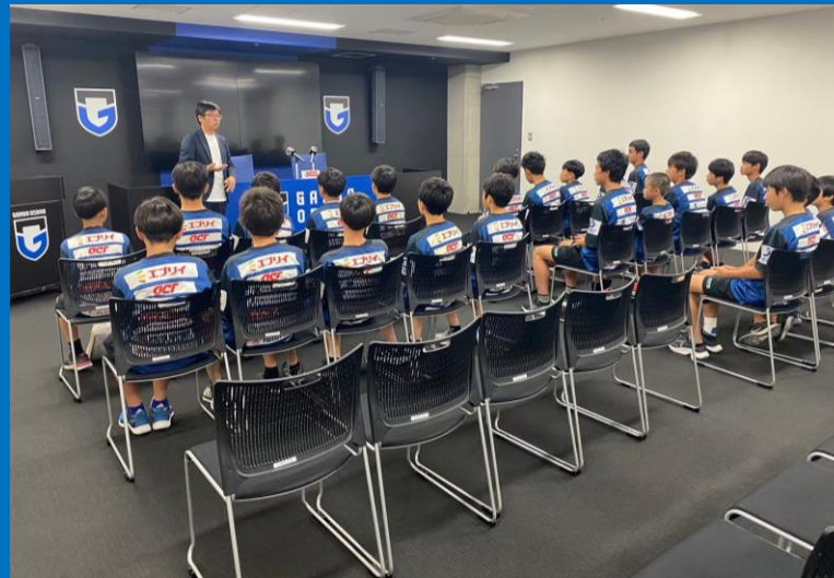
パナソニック スタジアムツアー (ガンバ大阪本拠地)